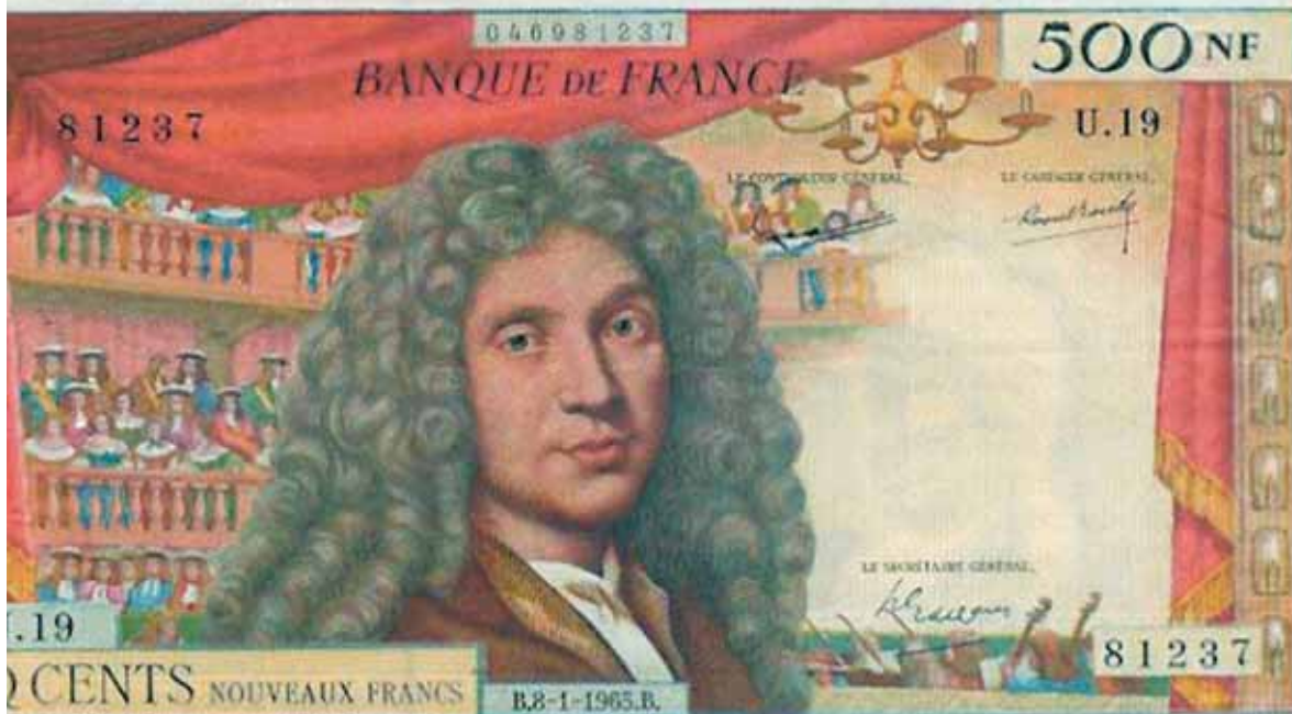
◁ Billet de banque (recto-verso) à l'effigie de Molière, imprimé entre 1959 et 1966 (cinq cents francs).