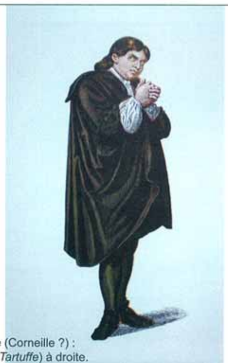
△ ▷ Deux personnages célèbres de Molière (Corneille ?) : Harpagon ( L'Avare ) à gauche et Tartuffe ( Le Tartuffe ) à droite.